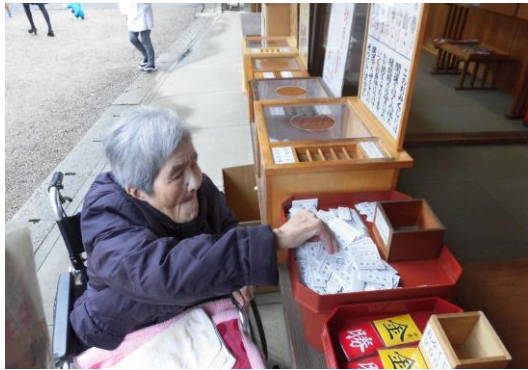
おみくじも引きました。