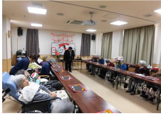
今年もよろしくお願いたします。