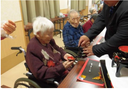
今年も健康で過ごせますように。