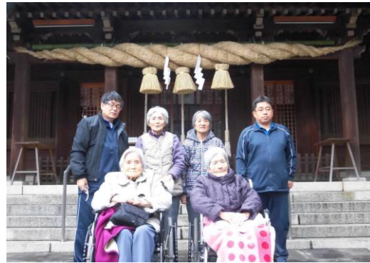
今年も良い年でありますように